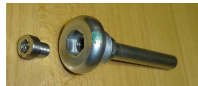
Kontrolle und Ablass